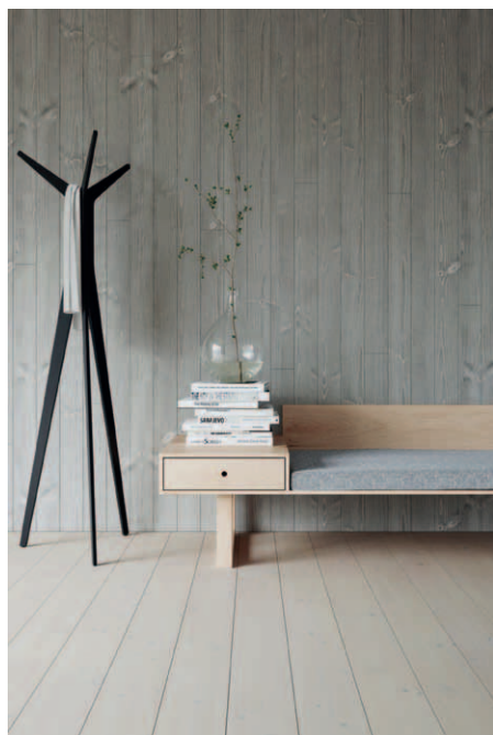
Borstad slätspont stengrå 15x118