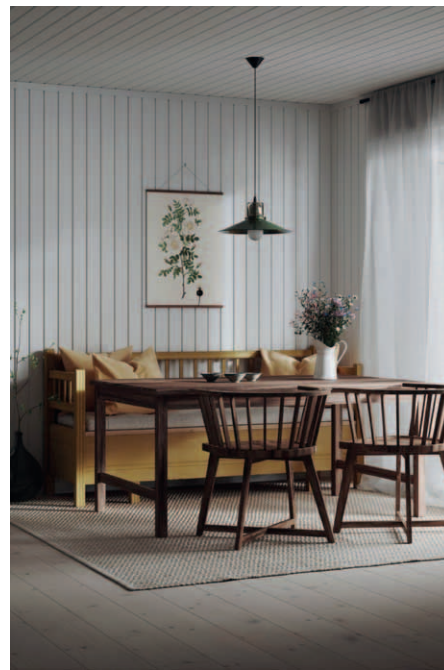
Putsad spårpanel vitmålad 15x120